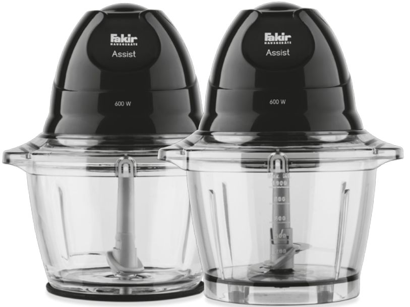
Cam Hazne / Glass Bowl